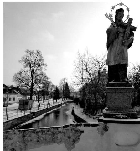
1. března 2018 v mrazech pokračovalo oklepání zdi na mostě sv. Jána. (Foto a text Martina Havlínová)