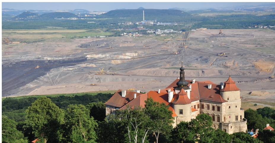
Zámek Jezeří u Horního Jiřetína

Jsem opravdu hrdý na stálost postojů většiny našich obyvatel. Velice si vážím toho, že si již tolik roků stojí pevně za svým a nedají se zlomit všemi těmi nabídkami, sliby, ale i výhružkami či pomluvkami. To je to nejcennější. Mám také velkou radost z řady našich spolků, které svou činnost hrdě spojují s Horním Jiřetínem a znamenitě tak pomáhají rozšiřovat pozitivní obraz našeho města po celé vlasti. Město tuto činnost všemožně podporuje.